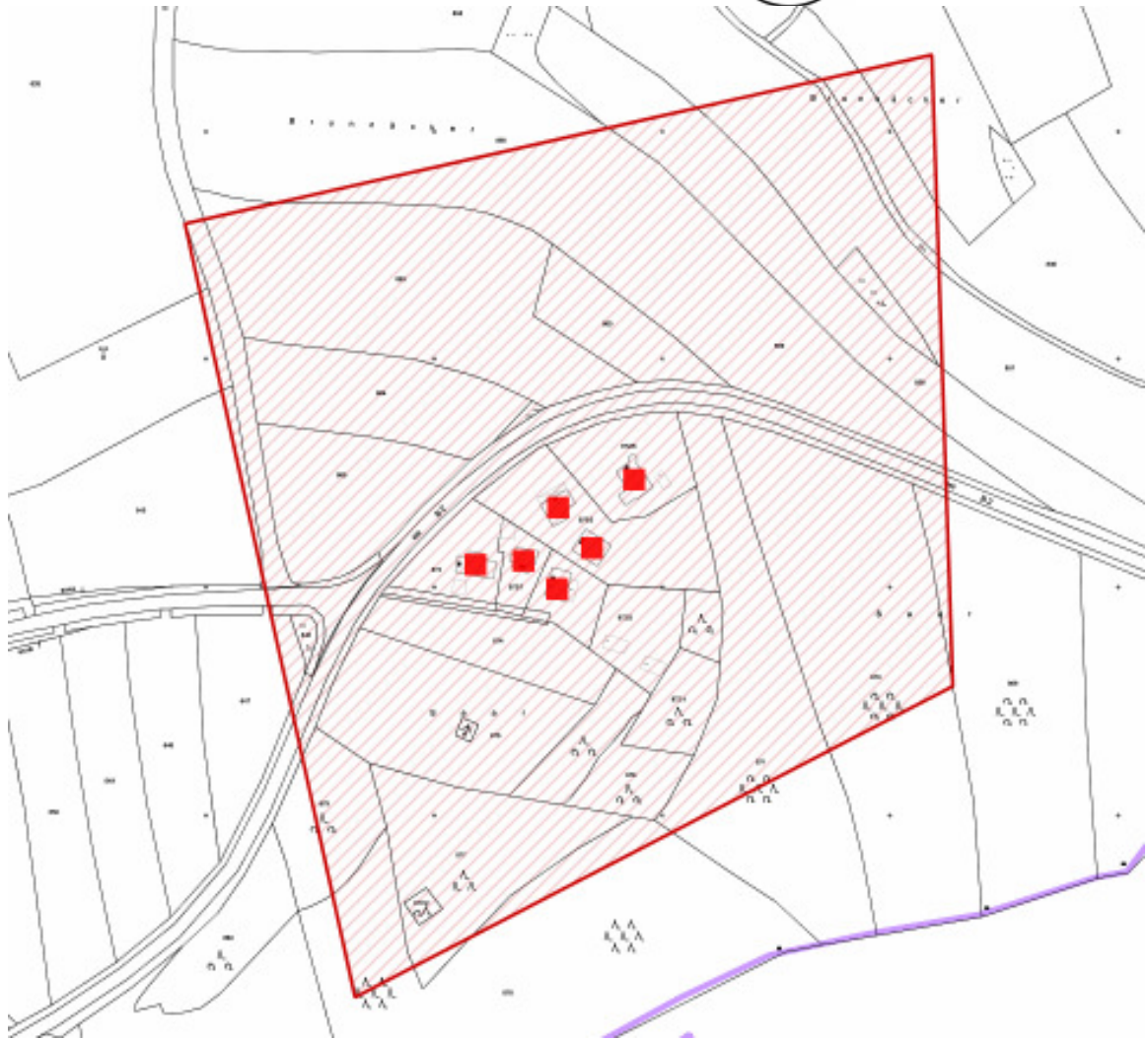
Karte 2: Neudorf SO